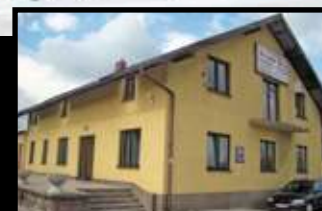
OLKUSZ OLEWIN 50c